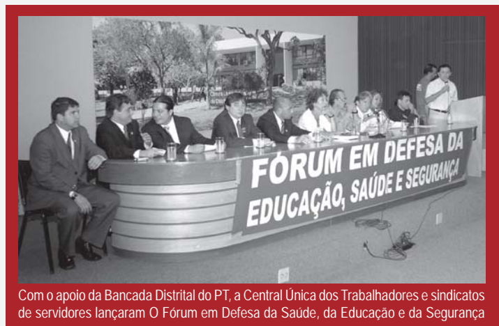
Com o apoio da Bancada Distrital do PT, a Central Única dos Trabalhadores e sindicatos de servidores lançaram O Fórum em Defesa da Saúde, da Educação e da Segurança

repasso do governo federal para o DF custear as três áreas aumentou de R$ 2,9 bilhões para mais de R$ 6 bilhões.