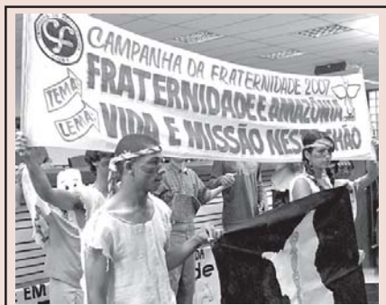
AMAZÔNIA: grupo jovem apresenta coreografia com tema da Campanha da Fraternidade 2007