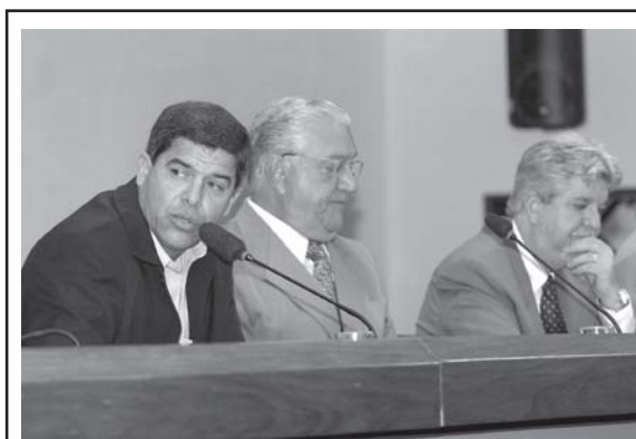
INCONSTITUCIONAL : audiência presidida pelo cabo Patrício analisou decreto do governador para fechamento do comércio pela polícia

O deputado Cabo Patrício (PT) também defendeu a integração da comunidade no combate à criminalidade. Mas alertou para o desgaste da imagem das polícias com as ações de fechamento de estabelecimentos. "Estive nas ruas por 10 anos e é muito desgastante para o policial ter que fechar um bar", disse.