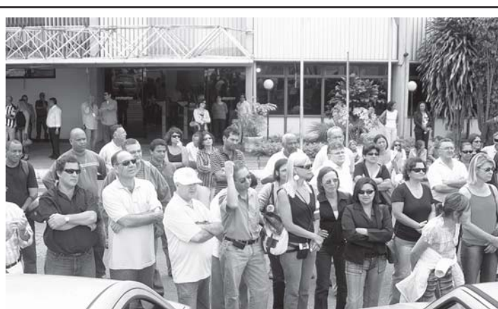
Mobilização dos servidores e bancada petista evitou fechamento da Codeplan

A bancada petista defendeu ainda que os trabalhos de informática do GDF continuem sendo