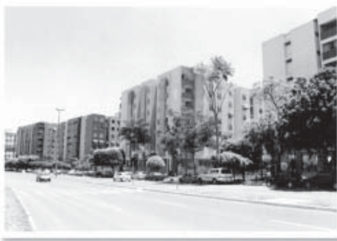
Inchaço no Guarã: prédios com 14 andares e mais carros na cidade

O PDL do Gama prevê parcelamento urbano em áreas rurais e permite a instalação de postos de combustíveis a cada mil metros. Já o plano do Guarã propõe novas áreas comerciais e residenciais com prédios de até 14 andares. O planejamento inadequado acarretará problemas como aumento do trânsito e sobrecarga dos equipamentos públicos (escolas, centros de saúde), que afetará a qualidade de vida nas duas cidades.