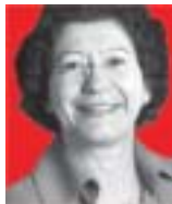
Deputada Arlete Sampaio

"O ano de 2005 foi, sem dúvidas, um ano difícil para nós, petistas. A onda de denúncias contra o Partido dos Trabalhadores, patrocinada por notórios praticantes de caixas dois e outras maracutaias, visa, fundamentalmente, enfraquecer o Governo Lula e levar o PT para a vala comum dos partidos tradicionais. Em 2006, precisamos renovar nossas esperanças, aprendendo com nossos erros e retomando o projeto de mudanças com as quais temos compromisso. Neste ano, o PT vai ter a chance de reconstruir suas relações com o povo brasileiro e brasileiro. Esse é o desafio que se coloca para todos nós".