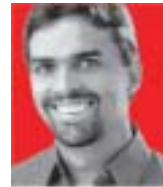
Deputado Paulo Tadeu

"Cabe a cada um de nós construir um novo ano, melhor do que o que passou. O ano novo também é aquele momento em que paramos para pensar no que fizemos de bom, no que não deu certo, no que precisamos melhorar, onde está o foco de nossa luta. Cabe a todos correr atrás do sonho para transformá-lo em realidade, então vamos trabalhar para a construção de uma sociedade justa, igualitária, em que a palavra exclusão perca totalmente seu significado. Para que cada um mereça um ano novo é preciso tentar, experimentar e ousar querer o melhor."