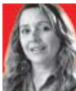
Deputada Erika Kokay

"Que em 2006 possamos reafirmar nossa condição única de sermos sujeitos dos nossos desejos, das nossas vidas, dos nossos sonhos e, principalmente, da construção de uma sociedade diferente. Onde as crianças não deixem de ser crianças antes do tempo, e onde caibam todos nós, na plenitude que só a mágica aventura humana possibilita. Um forte abraço."